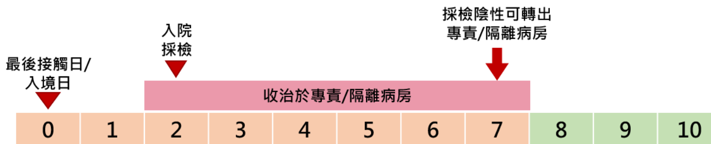
圖三、居家隔離或檢疫者住院期間採檢規定說明